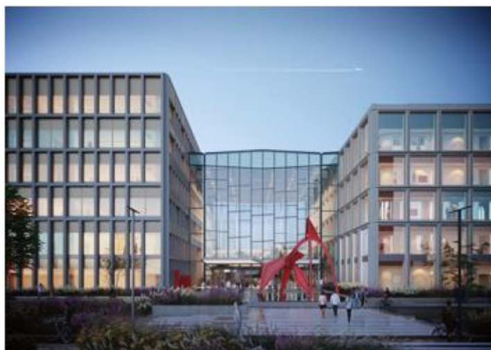
Artist impression Research & Diagnostiek Centrum ADORE en atrium (door Studio Hartzema). Zie tevens afbeelding op voorpagina.

Kortom: wij willen een lange-termijn onderzoeksinfrastructuur garanderen, zodat de besten van de besten weten dat ze bij ons ook voor langere tijd aan uniek en grensverleggend onderzoek kunnen werken.