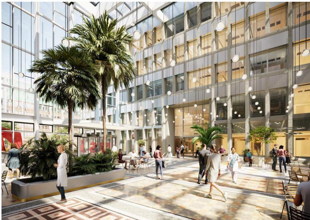
Artist impression van het atrium (door Studio Hartzema)

De economische en sociale gevolgen van de wereldwijde crisis rond COVID-19 en de oorlog in Oekraïne, zullen waarschijnlijk voelbaar blijven in de mate waarin schenkers bedragen willen toekennen aan ADORE. Aangezien er in 2021 wederom geen vermogensbestanddelen zijn belegd, wordt de stichting niet direct geraakt door koersfluctuaties n.a.v. deze crisis.