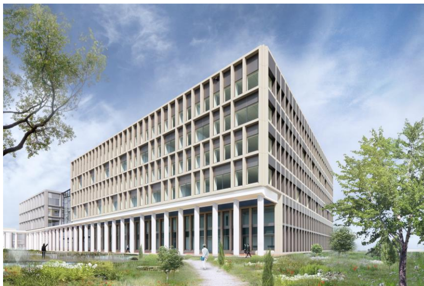
Artist impression Research & Diagnostiek Centrum (door Atelier PRO)