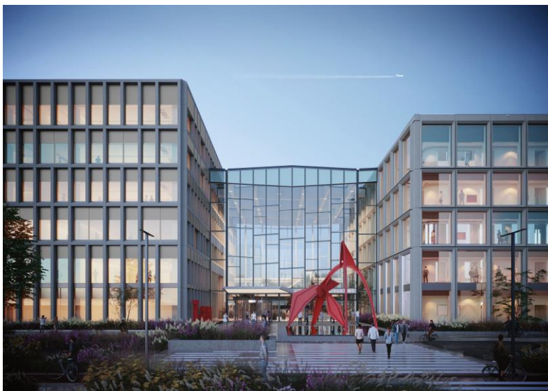
Artist impression Research & Diagnostiek Centrum en atrium (door Studio Hartzema). Zie tevens afbeelding op voorpagina.

Kortom: wij willen een lange-termijn onderzoeksinfrastructuur garanderen, zodat de besten van de besten weten dat ze bij ons ook voor langere tijd aan uniek en grensverleggend onderzoek kunnen werken.